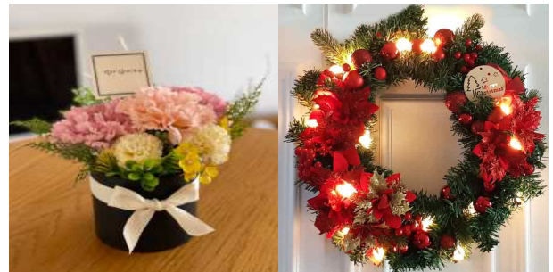
센터피스(리본공예) / 크리스마스 리스