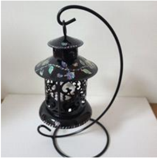
자개 엔틱등 만들기