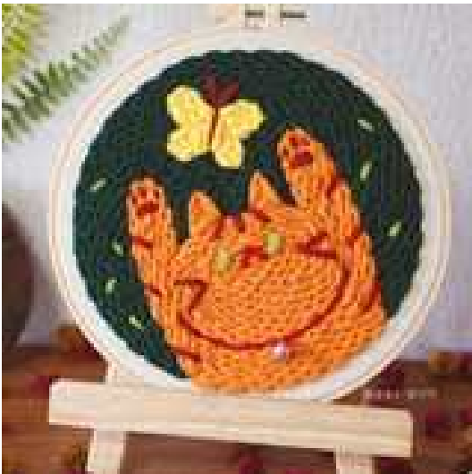
편치니들 자수 만들기