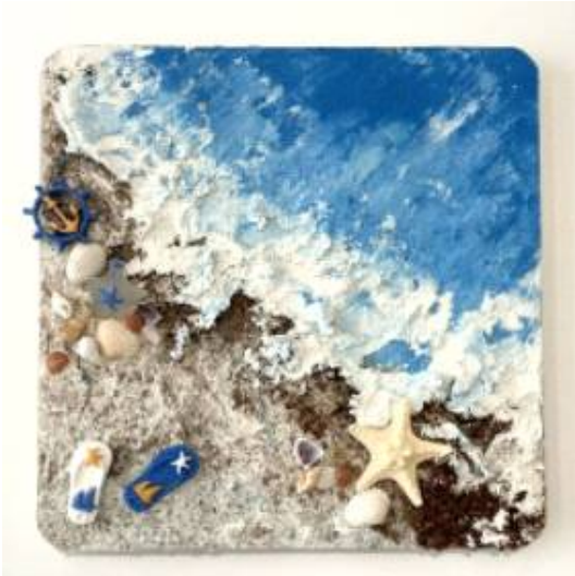
바다 풍경 액자 만들기