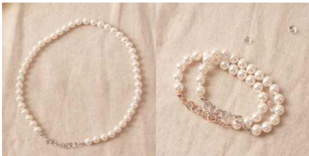
진주를 이용한 선물 만들기