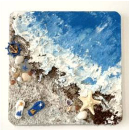
바다 풍경 액자 만들기